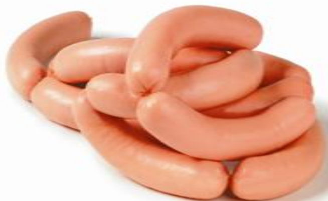
Сосиски «Лакомые» н/о

Оригинальное сочетание свинины и говядины с добавлением сливок и классических специй усиливают вкусовые ощущения и вызывают чувство насыщения.