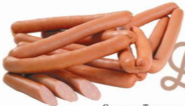
Сосиски «Тирольские» н/о

Оригинальное сочетание свинины и говядины с добавлением сливок и классических специй усиливают вкусовые ощущения и вызывают чувство насыщения.