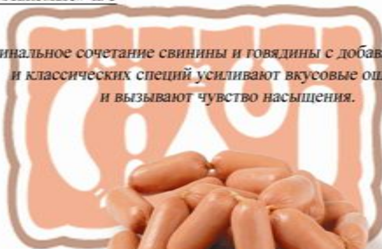
Сосиски «Ветчинные» бел/об.

Гармоничное соединение мясных компонентов и голландского сыра, дополненное оригинальным сочетанием специй из Центральной Европы, придают сосискам экзотические пряные ноты и оставляют гармоничное послевкусие, усиливающееся при нагревании продукта..